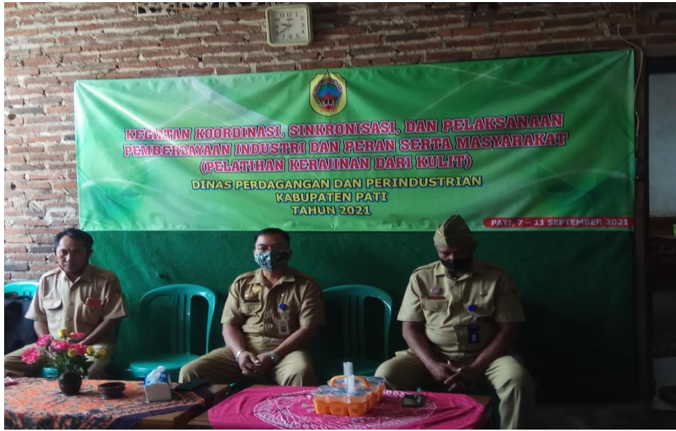
Foto Kegiatan Bidang Industri Seksi ILMEA Tahun 2021 Koordinasi Masyarakat, Pelatihan kerajinan kulit Desa Swaduk 7-11 September 2021