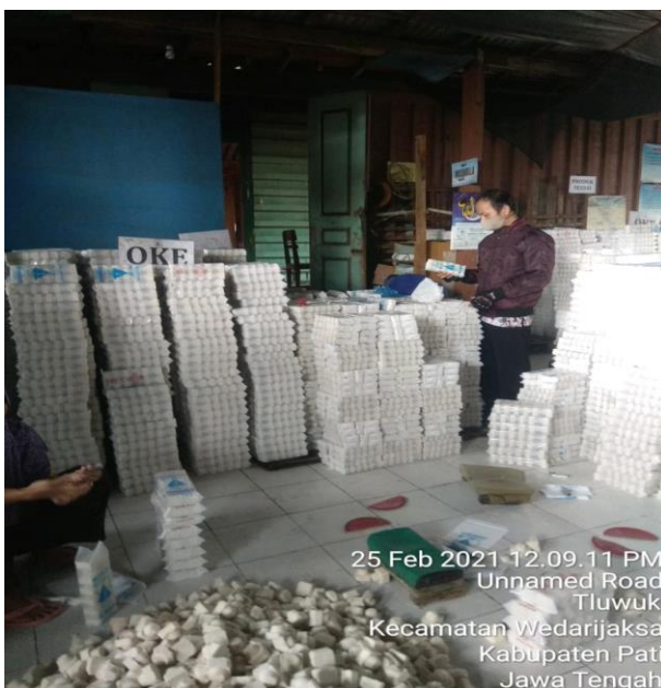
25 Feb 2021 12.09.11 PM Unnamed Road Tluwuk Kecamatan Wedarijaksa Kabupaten Pati Jawa Tengah