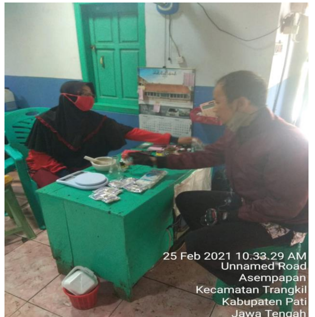
25 Feb 2021 10.33.29 AM Unnamed Road Asempapan Kecamatan Trangkil Kabupaten Pati Jawa Tengah