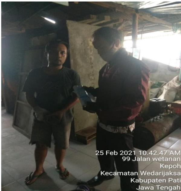
25 Feb 2021 10.42.47 AM 99 Jalan wetanan Kepoh Kecamatan Wedarijaksa Kabupaten Pati Jawa Tengah