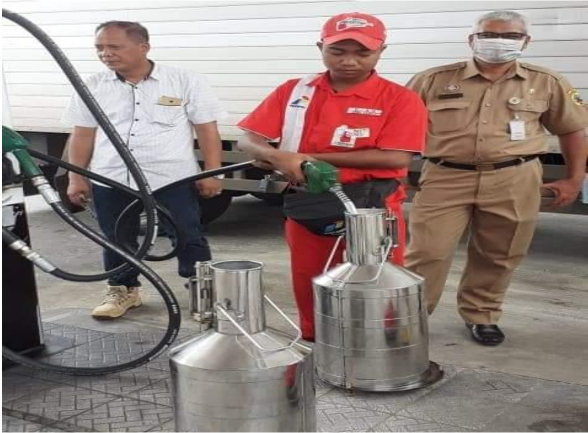
Foto Kegiatan Metrologi Legal Tahun 2021