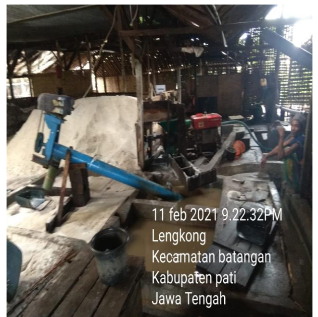
11 feb 2021 9.22.32PM Lengkong Kecamatan batangan Kabupaten pati Jawa Tengah