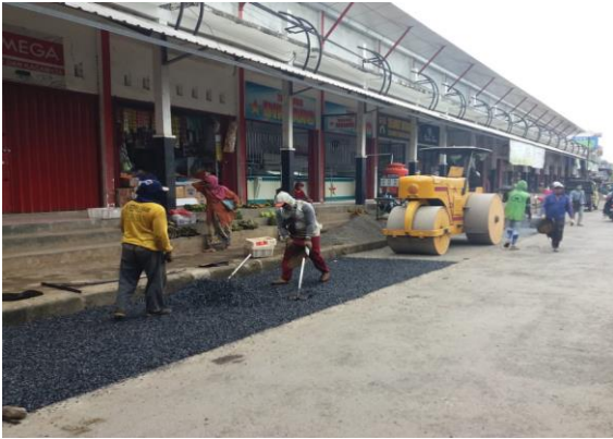
Foto Kegiatan Bidang Pasar Tahun 2021 Pasar Daerah Kabupaten Pati Pengaspalan Pasar Tayu