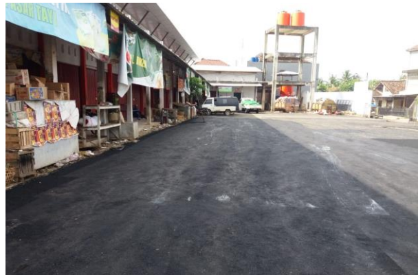
Pengurugan Pasar Kayen