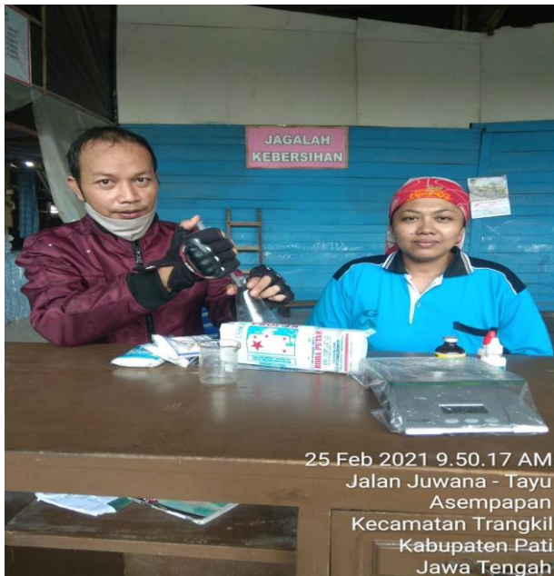
25 Feb 2021 9.50.17 AM Jalan Juwana - Tayu Asempapan Kecamatan Trangkil Kabupaten Pati Jawa Tengah